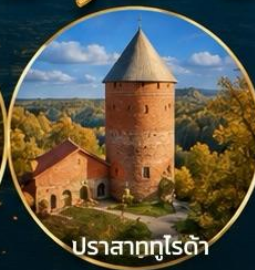
ปราสาทกูไรต้า