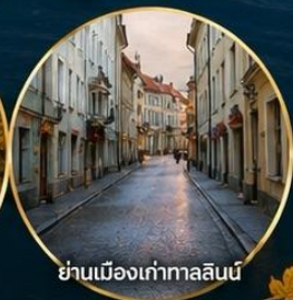
ย่านเมืองเก่าทาลลินน์