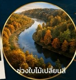
ช่วงใบไม้เปลี่ยนสี