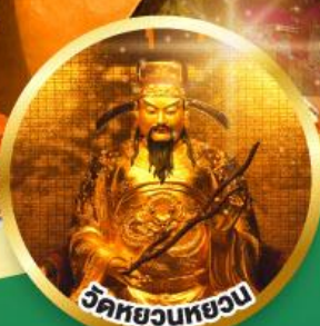
วัดหยวนหยวน ขอพรเรื่องสุขภาพ, โชคลาภ ความเจริญก้าวหน้า

เมนูพิเศษ! ต้มช้ำฮ่องกง, บุฟเฟต์ซาบูสไตล์ฮ่องกง, ห่านย่าง