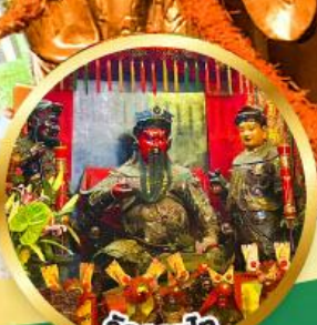
วัดกวนโก ขอพรเทพเจ้ากวนอู เงินทอง, ธุรกิจมั่นคง