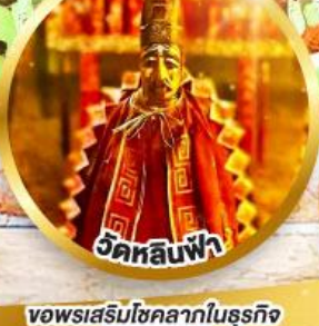
วัดลีนฟ้า ขอพรเสริมโชคลาภในธุรกิจ และการเงิน