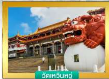
วัดเหวินหวั่น