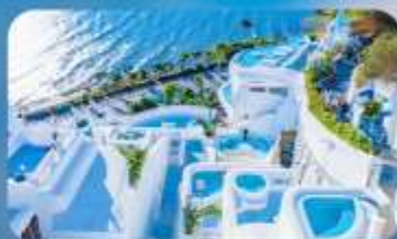
ซาโตรินี่