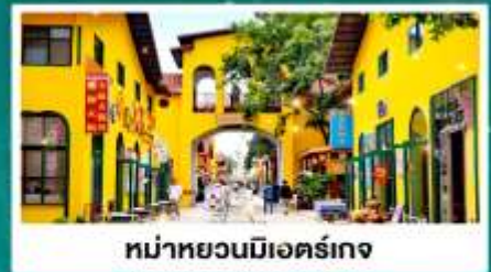
หม่าหยวนมีเออร์เกง