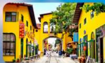
หมาหยวนมีเอตร์เกจ