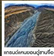
แกรนด์แคนยอนตู้ซานจือ