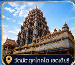
วัดมัตตุกโกโคโต เซดเตียร์