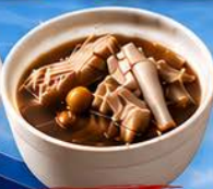
มะกูดเต๋