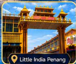
Little India Penang