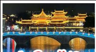
เมืองโบราณไท่ผิง