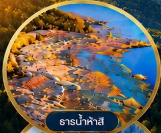
ธารน้ำห้ำสี่