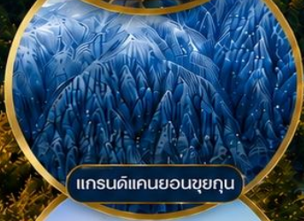
แกรนด์แคนยอนซูยกุน