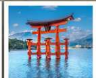
ศาลเจ้าอิตสึคุชิมะ