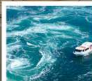
คลองเรือขมบ้านนาสุโตะ

คลองเรือขมบ้านนาสุโตะ / ซุปบึงย่านชินโซบาช / ตลาดปลาคุโรมาง / ซุปบึงย่านอุเมดะ