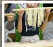
กิจกรรมทำเส้นอุด้ง