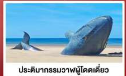
ประติมากรรมวาฬผู้โดดเดี่ยว