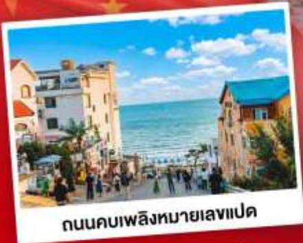
ถนนคอปเปลิ่งหมายเลขแปด