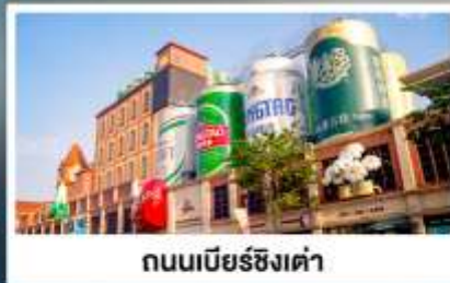
ถนนเบียร์ชิงเต่า