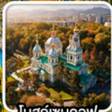
โบสถ์ขันทอฟ

นั่งกระเช้าคอนโดล่าขึ้นสู่ชิมบูลัก สตรีสอร์ท ไร่มุกแห่งเทือกเขาเทียนชาน ทะเลสาบโคลโซ หุบเขาเจดี ไอกูซ / ภูเขาหินเทพนิยาย / ทะเลสาบอัสซิกกุล ชมการแสดงการล่าเหยื่อของนกอันทรื