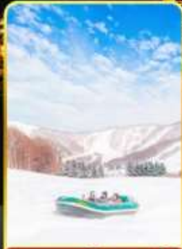
กิจกรรมสโนว์ราฟติง