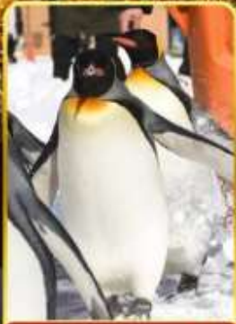
บิกชามารีนพาร์ค