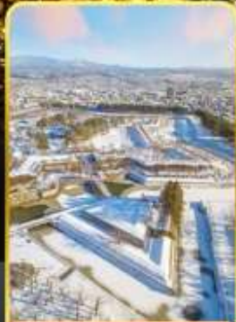
หอดาวห้าแฉก