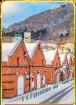
โกดังอิฐแดง