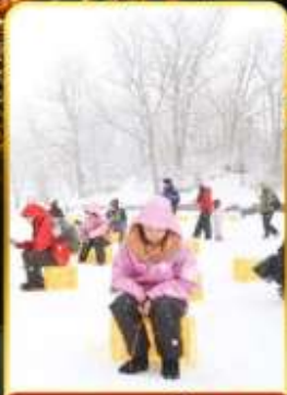
ตกปลาน้ำแข็ง