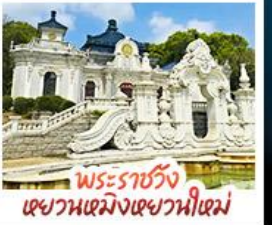
พระราชวัง แคว้นเซมิงเซวานีเซม