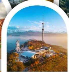
จุดชมวิวเขาค็อกโทเบ