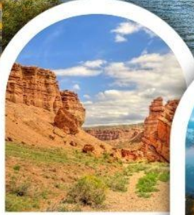
ซารินแคนยอน