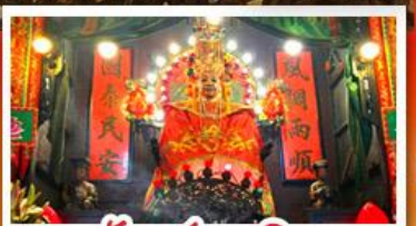
วัดแชกงเมิว