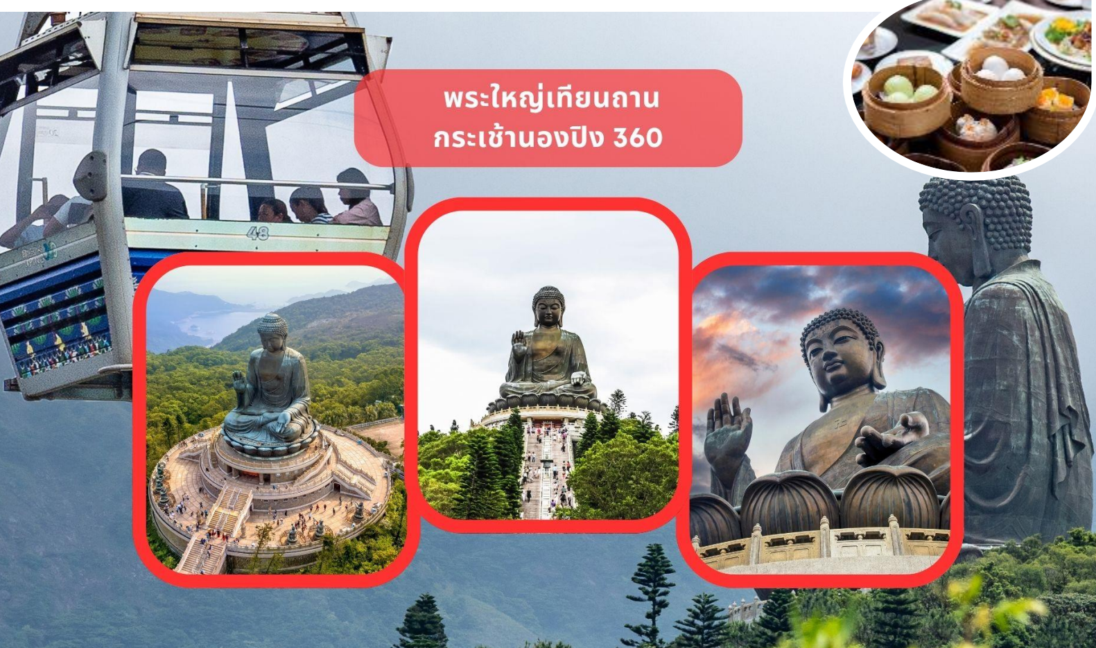
พระใหญ่เทียนถาน กระเช้านองปิง 360

เช้า รับประทานอาหารเช้า ณ ภัตตาคาร บริการท่านด้วยเมนูติ่มซำฮ่องกง (มื้อที่ 2)