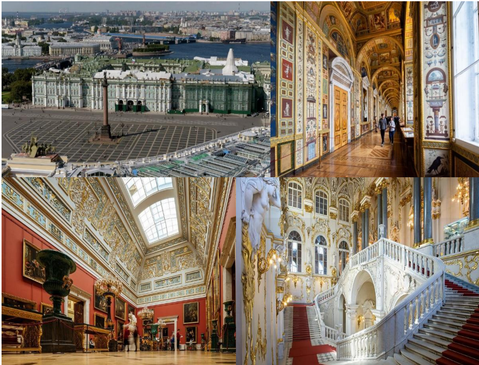
ค่ำ รับประทานอาหารค่ำ ณ ภัตตาคาร (อาหารจีน) นำท่านเข้าสู่ที่พัก Cosmos Saint-Petersburg Pribaltiyskaya Hotel หรือเทียบเท่า (คืนที่ 6)

นำท่านแวะถ่ายภาพ โบสถ์หยดเลือด (Church of the Savior on Spilled Blood) (ถ่ายภาพด้านนอก) เป็นอนุสรณ์ที่พระเจ้าอเล็กซานเดอร์ที่ 3 สร้างขึ้นเพื่อรำลึกถึงพระบิดาพระเจ้าอเล็กซานเดอร์ที่ 2 ผู้ปลดปล่อยชาวนา ซึ่งถูกลอบปลงพระชนบริเวณนี้ หลังจากนั้นนำท่านสู่ มหาวิหารคาซาน (Kazan Cathedral) (ถ่ายภาพด้านนอก) สร้างขึ้นเพื่ออุทิศให้กับพระแม่แห่งคาซาน โดยสถาปนิก Andrey Voronikhin สร้างแบบจำลองอาคารตามมหาวิหารเซนต์ปีเตอร์ในกรุงโรม ภายในมหาวิหารมีเสาจำนวนมากสะท้อนถึงเสาหินเรียงแถวภายนอก ภายในมีประติมากรรมและไอคอนมากมายที่สร้างสรรค์โดยศิลปินชาวรัสเซียชั้นนำ