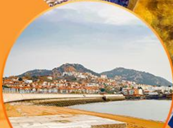
ซาจื่อโป