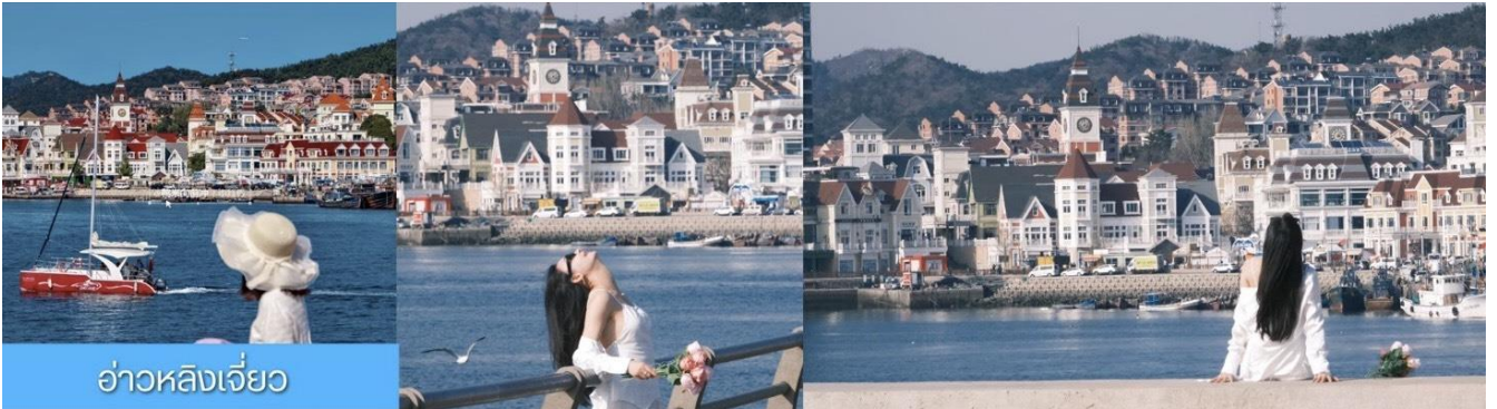
อ่าวหลิงเจี้ยว

จากนั้นนำท่านเที่ยวชม ท่าเรือประมงหู่กาน 大连渔人码头 เป็นจุดเช็คอินที่โดดเด่นด้วยสถาปัตยกรรมสไตล์ยุโรปสีสันสดใส ผสมผสานกลิ่นอายเมืองท่าดั้งเดิมเข้ากับบรรยากาศสุดโรแมนติกที่เต็มไปด้วยเรือประมง คาเฟ่ ร้านอาหาร และจุดชมวิวยุริมาทะเล