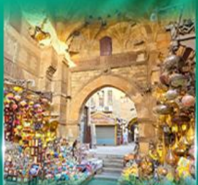
ตลาดท่านเอลกาลลี