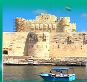
บ่อนปราการ Quite Bay