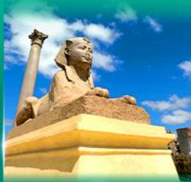
เสาสีมันบอมเบย์