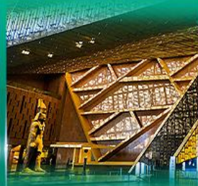
พิพิธภัณฑ์แกรนด์อียิปต์ (GEM)