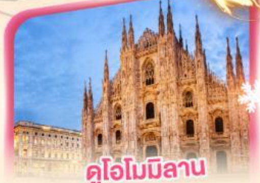
คูโอโมมิลา