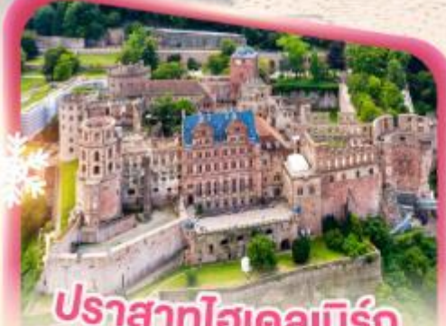
ปราสาทโฮเดลเบิร์ก