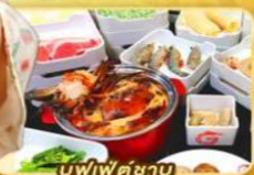
บูฟเฟต์ชาบู