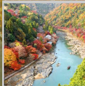
“ARASHIYAMA MT. KAMEYAMA”