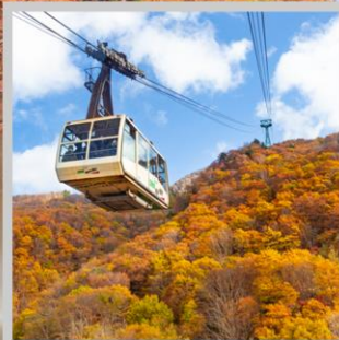
“ZAO CHUO ROPEWAY”