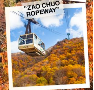
"ZAO CHUO ROPEWAY"

วันเดินทาง 30 ต.ค. - 5 พ.ย. 2569 4 - 10 พ.ย. 2569