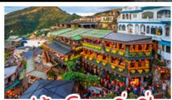
หมู่บ้านโบราณจีวเฟิ่น