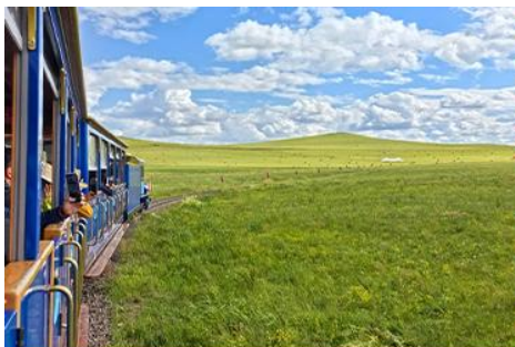
ชมบ้านชาวมองโก

เที่ยง รับประทานอาหารกลางวัน ณ ภัตตาคาร (14)