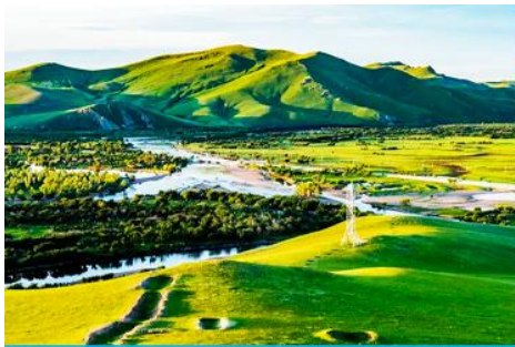
ภูเขาเหยซานโถว

เช้า รับประทานอาหารเช้า ณ ห้องอาหารของโรงแรม (13)