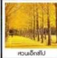
สวนเอ็กซ์โป