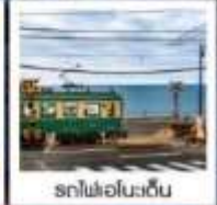
รถไฟเอโนะเด็น