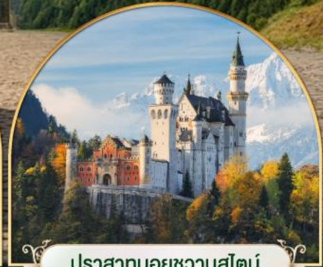
ปราสาทนอยชวานสไตน์ เยอรมนี