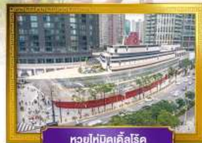
ทวยไห่บิคเคิลโรด