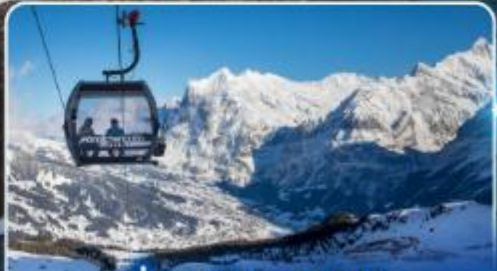
นั่งกระเช้าและรถไฟสุด อลเวงจากุงเฟรา