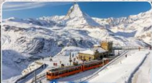
นั่งรถไฟสุดอลเวง กรอนเนอร์เกรต