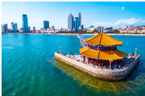
สะพานเทียนเจียว

เช้า รับประทานอาหารเช้า ณ ห้องอาหารของโรงแรม (1)