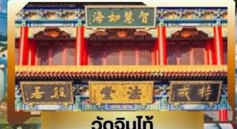
วัดจีนไท้