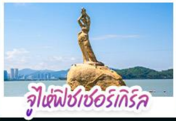
จุ้ยเซี๊ยะซอร์เทีร์ริค