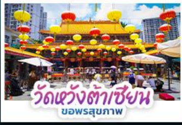
วัดหวังต้าเซียน บอพรสุขภาพ