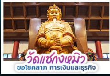
วัดชงกวงเมิว ขอโชคลาภ การเงินและธุรกิจ