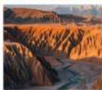
แกรนด์แคนยอนดูซานจื่อ