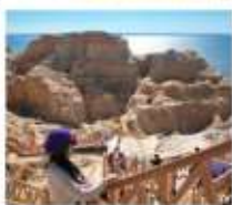
เขตปิกางทะเล