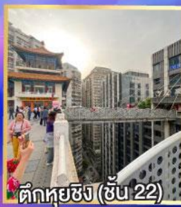
ตึกหุ่ยซิง (ชั้น 22)