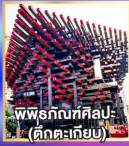
พิพิธภัณฑ์ศิลปะ: (ตึกตะเกียบ)