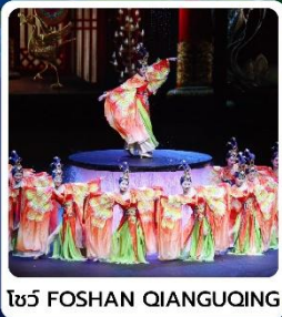
โชว์ FOSHAN QIANGUING