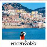
หาดซาจื่อฮั่ว