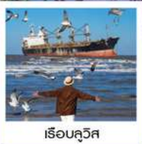
เรือลิวอิส