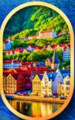
พิกเมืองเบอร์เก็น