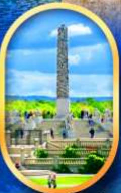
วิกเกอร์แลนด์