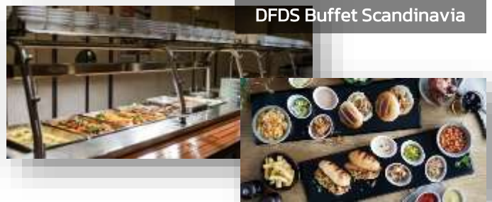
DFDS Buffet Scandinavia

ค่ำ บริการอาหารค่ำแบบบุฟเฟ่ต์ ณ ห้องอาหารของเรือ DFDS