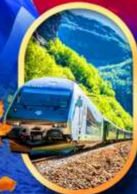
รถไฟฟลิมสบาน่า