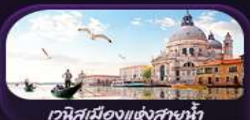
เวนิสเมืองแห่งสายน้ำ

ROME FLORENCE PISA COMO LUCERNE JUNGFRAUJOCH PARIS