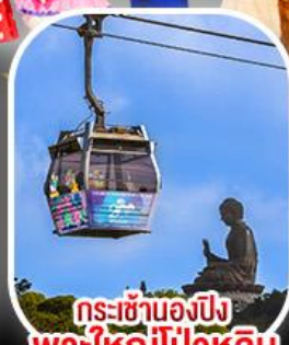
กระเช้าองปีง พระใหญ่ไผ่หลิน