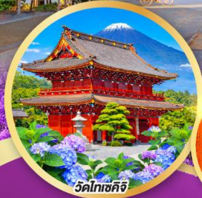
วัดโทเชคิจิ