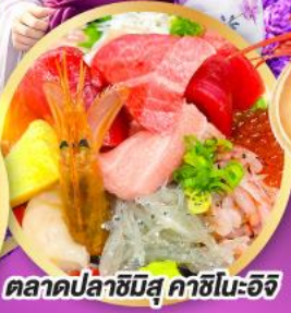
ตลาดปลาฮิมิสึ คาชิโนะอิชิ