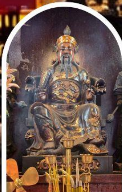
วัดปักไต

ขอเทพเจ้ากวนอู ความซื่อสัตย์ เงินทอง ธุรกิจมั่นคง