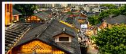
เมืองโบราณสือปาตี