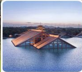
พิพิธภัณฑ์ไต้หน้ำกวงฟู่หลิน