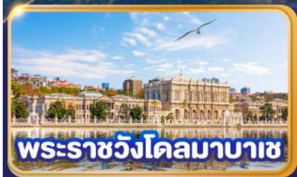
พระราชวังโดลมาบาซ