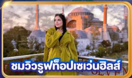
ชมวิวยุททอปเซเวนฮิลส์