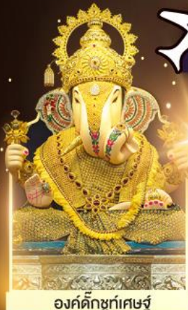
องค์ดีกษุท์เศษฐ์