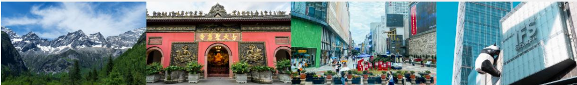
ภูเขาสีดรุณี (หุบเขาชวงเจียวโกว)