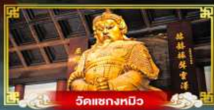
วัดเขangkทิว