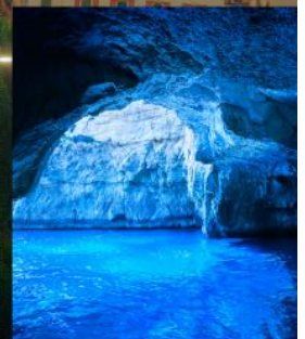
BLUE GROTTO CAPRI